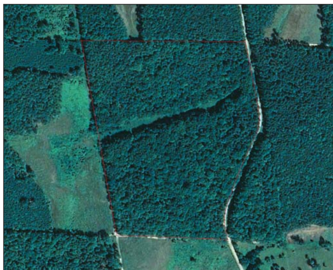
6. ábra. Az öreg erdőt két oldalról kiterjedt vágásterületek határolják. Ezért a magterület védtelenné és a külső behatásoknak hosszú időre erősen kitetté vált. A rezervátum másik két oldalán húzódó védőzónában egyelőre betölti szerepét az erdő

esetében is előfordulhat, hiszen a védőzónák döntően középkorú állományait leginkább vágásos módon kezelik.