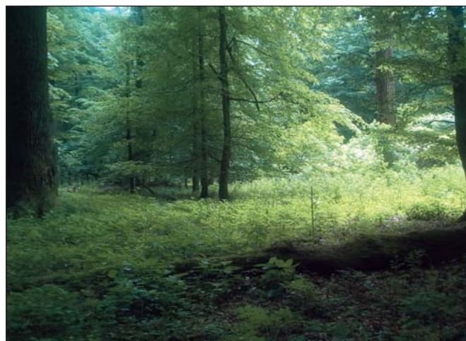
4. ábra. Öreg alföldi gyertyános-kocsányos tölgyes egy ligetes állománya a Baktai-erdő Erdőrezervátum magterületén

Minél több vágásterület található a védőzónában, annál rosszabb ez a kedvezőtlen hatás – ilyenkor a védőzóna nem tudja betölteni védő, kiegyenlítő, csillapító szerepét (6. ábra). Ez a lehetőség a közeljövőben még több erdőrezervátum