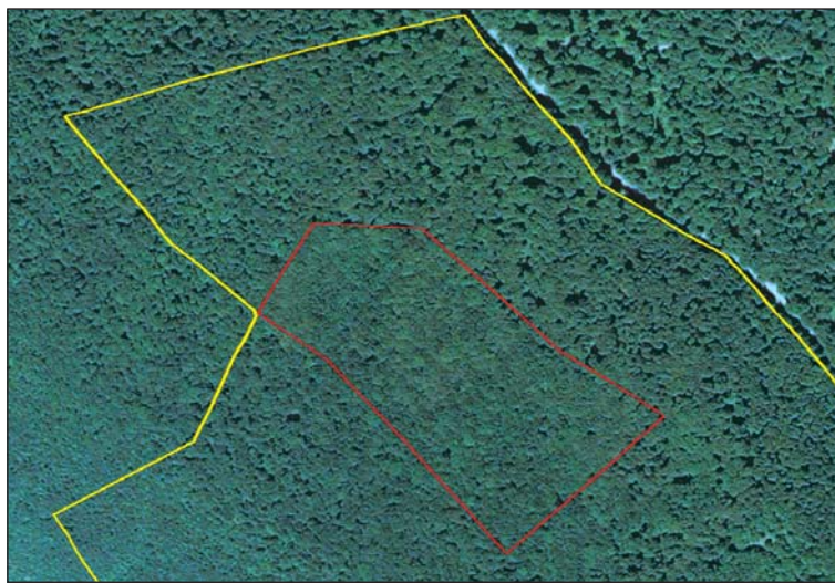
1. ábra. A 2013-as űrfelvételen a piros vonallal lehatárolt folt az erdőrezervátum magterülete. A védőzóna határát sárga vonal mutatja. A védőzónában csoportos szállalással kialakított kisméretű lékek látszanak, míg a magterület lombkoronasátra még teljesen egyöntetű és zárt

Ezzel szemben a természetvédelem és az erdőrezervátum-kutatók fő elvárása a terület védő funkciójának hosszú távú fenntartása a lucos állomány fokozatos átalakítása, illetve átalakulása során.