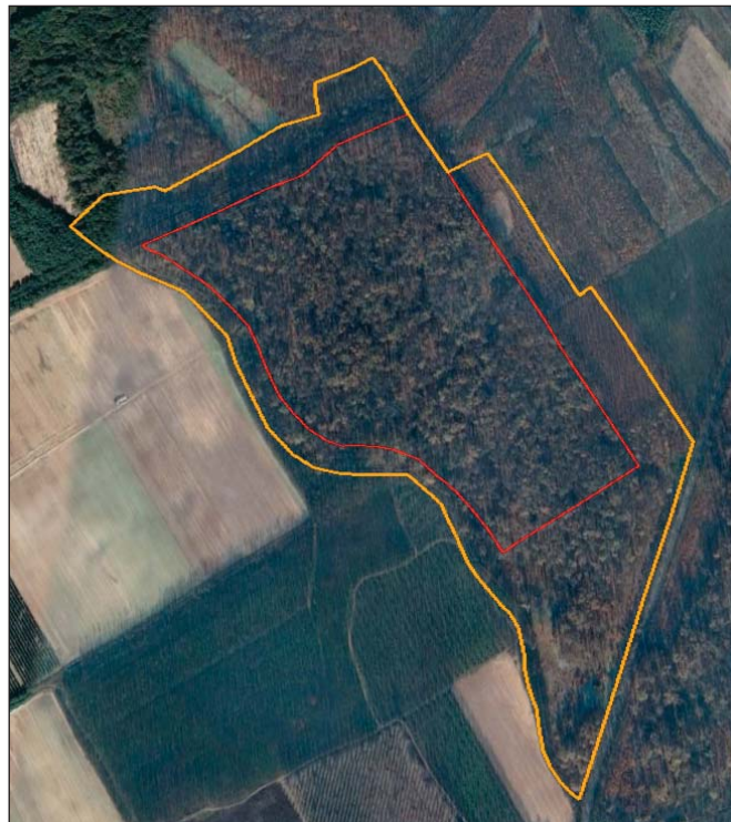
5. ábra. A Baktai-erdő ER űrfelvétele 2019-ből. A védőzóna keskeny és zavart. A közvetlen szomszédságban szántó és akácos kultúrerdők vannak