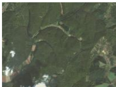
Vétyem ER és környéke, NÉBIH EI - Google úrfelvétel Vétyem Erdőrezervátum NÉBIH EI - Google 2012 orto_36v.jpg