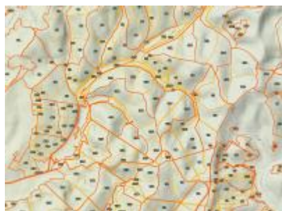
Vétyem ER és környéke, NÉBIH EI Erdőtérkép - Google TOPO Vétyem Erdőrezervátum NÉBIH EI - Google 2012 topo_36v.jpg