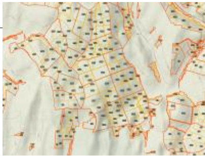
Remetekert ER és környéke, NÉBIH EI Erdőtérkép - Google TOPO Remetekert Erdőrezervátum NÉBIH EI - Google 2012 topo_37v.jpg