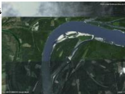
Kádár-sziget ER és környéke, NÉBIH EI - Google úrfelvétel