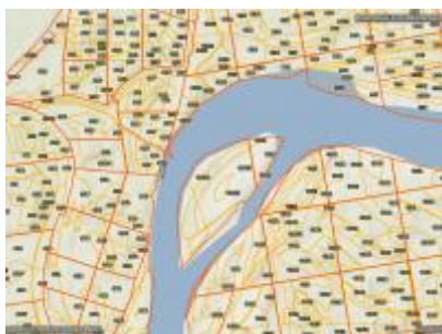
Kádár-sziget ER és környéke, NÉBIH EI Erdőtérkép - Google TOPO