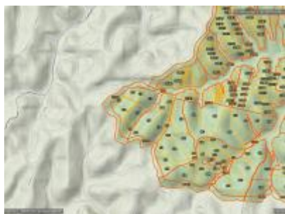
Szabó-völgy ER és környéke, NÉBIH EI Erdőtérkép - Google TOPO