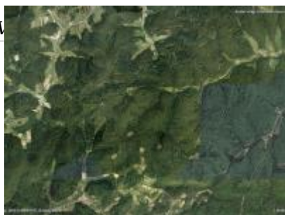
Szabó-völgy ER és környéke, NÉBIH EI - Google úrfelvétel