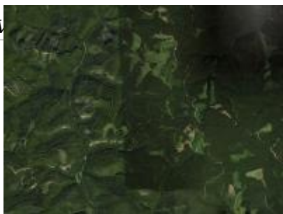
Pataj ER és környéke, NÉBIH EI - Google úrfelvétel