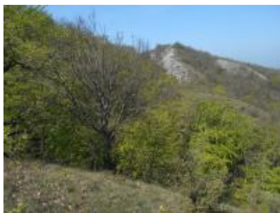
Lejtősztyep és bokorerdők a Kiszénás ER magterületén Kis-Szénás Erdőrezervátum Horváth Ferenc (MTA ÖK) 2016 DSCN1369.JPG