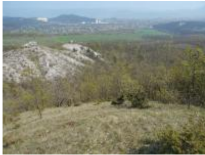
Kilátás a Kiszénásról Pilisszentiván, Pilisvörösvár felé Kis-Szénás Erdőrezervátum Horváth Ferenc (MTA ÖK) 2016 DSCN1370.JPG