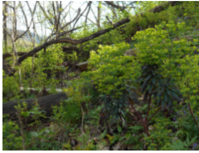
Erdei kutyatej populáció "robbanása" a jégtörés miatt kiligetesedett erdőben (MVP) Kis-Szénás Erdőrezervátum 2016 ER-08_KISSZENAS_ERDEI_KUTYATEJEK_DSCN1353.PNG