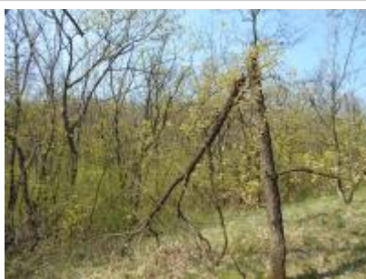
Törzstörött fiatal molyhos tölgy a Kiszénás ER magterületén Kis-Szénás Erdőrezervátum Horváth Ferenc (MTA ÖK) 2016 DSCN1371.JPG