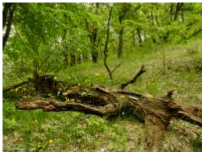
Régóta korhadó tölgy a Kiszénás ER molyhos tölgyes bokorerdőjében Kis-Szénás Erdőrezervátum 2016 ER-08-3_Bajomi_Balint_2016_4012_web.jpg