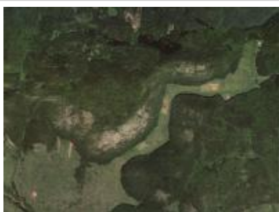
Nagy-oldal ER és környéke, NÉBIH EI - Google úrfelvétel Nagy-oldal Erdőrezervátum NÉBIH EI - Google 2012 orto_71v.jpg