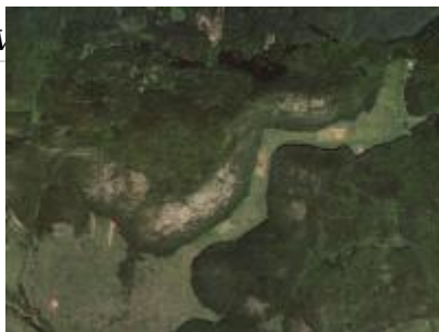
Nagy-oldal ER és környéke, NÉBIH EI - Google úrfelvétel