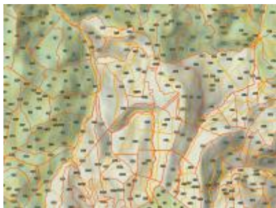
Nagy Sertés-hegy ER és környéke, NÉBIH EI Erdőtérkép - Google TOPO Nagy-Sertéshegy Erdőrezervátum NÉBIH EI - Google 2012 topo_64v.jpg