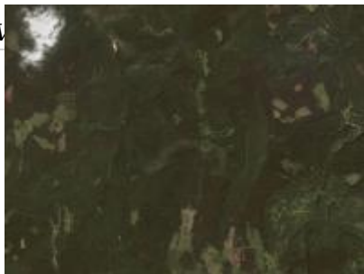
Nagy Sertés-hegy ER és környéke, NÉBIH EI - Google úrfelvétel Nagy-Sertéshegy Erdőrezervátum NÉBIH EI - Google 2012 orto_64v.jpg