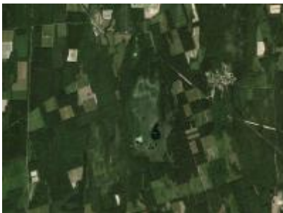
Baláta-tó ER és környéke, NÉBIH EI - Google úrfelvétel Baláta-tó Erdőrezervátum NÉBIH EI - Google 2012 orto_28v.jpg