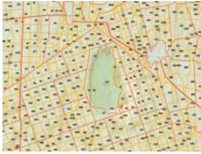
Baláta-tó ER és környéke, NÉBIH EI Erdőtérkép - Google TOPO Baláta-tó Erdőrezervátum NÉBIH EI - Google 2012 topo_28v.jpg